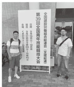
会場に到着した2選手

後悔したくない思いは強く、いままでの経験、悔しさを全てぶつける思いで練習してきました。迎えた本大会では、緊張もせず、集中して作業して、パニックにならずミスを感じては、普段では考えられないミスを数回してしまい、無意識のつもりでも最後という思いが普段通りの作業をさせませんでした。パニックにならずミス